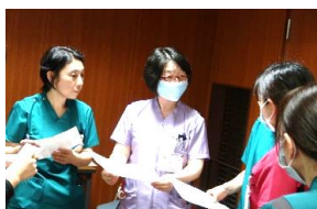
シナリオに沿ってのロールプレイ