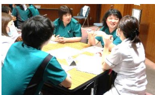
グループ内での話し合い