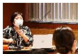
中山次長による講義